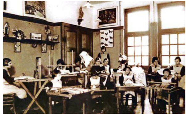
Artesanía en Drütten