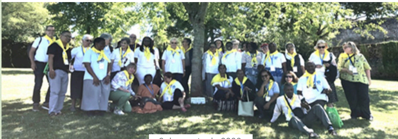
9 de agosto de 2023

Este árbol simboliza el crecimiento y la vitalidad de los Amigo-as de la Sabiduría en la senda de las Hijas de la Sabiduría del mundo entero, unidas en torno a su misión: ¡Juntos, amemos, vivamos y proclamemos la Sabiduría!